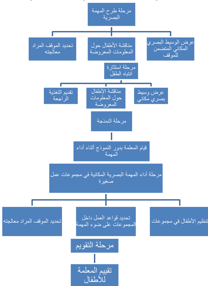
شكل رقم (١) خطوات التدريس بالمدخل البصري المكاني